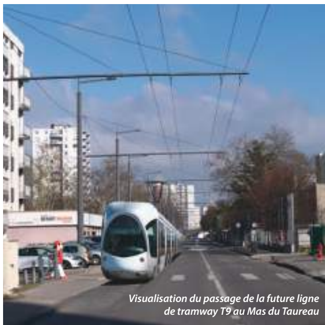
Visualisation du passage de la future ligne de tramway T9 au Mas du Taureau

• Développer dans toute la ville des itinéraires sécurisés pour les modes « doux » (vélos, piétons)