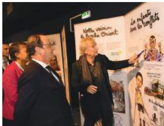
Le dessinateur de presse Plantu présente l'exposition de son association Cartooning for Peace à l'ancien Président de la République François Hollande, à l'occasion d'un colloque organisé à Vaulx-en-Velin en 2019