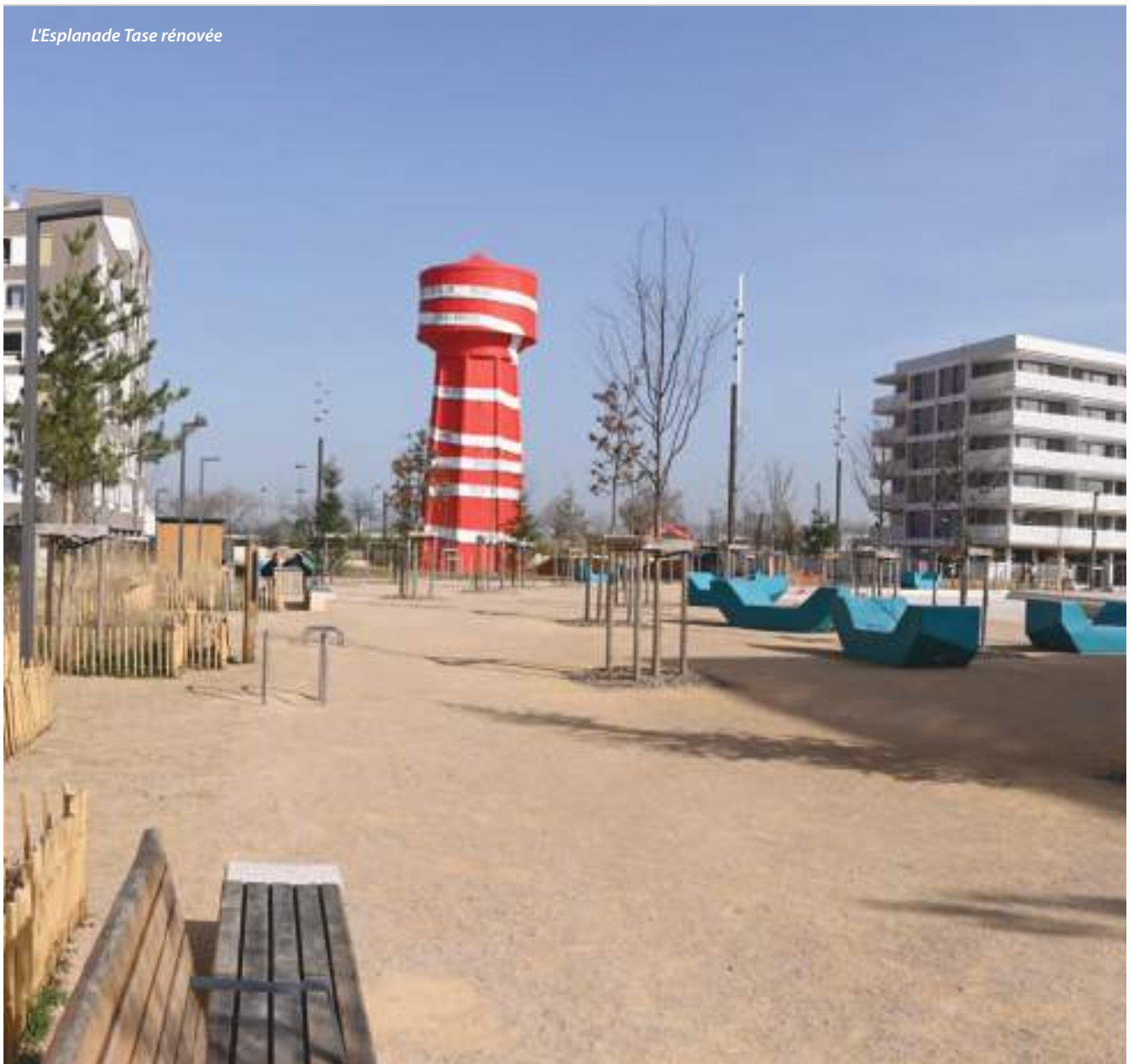
L'Esplanade Tase rénovée