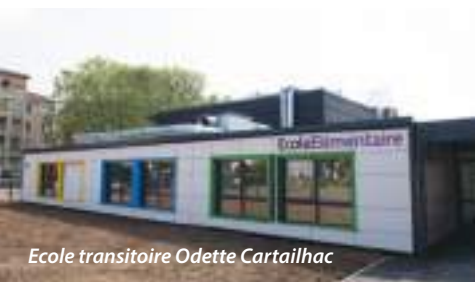
Ecole transitoire Odette Cartailhac

Nous allons poursuivre et intensifier notre programme de construction et de rénovation des groupes scolaires, mobiliser des dispositifs éducatifs et de formation comme la Cité Educative ou le Campus des Métiers et des Qualifications, accueillir une nouvelle école d'ingénieurs tout en accompagnant le développement économique de notre territoire et en soutenant l'emploi des Vaudais.