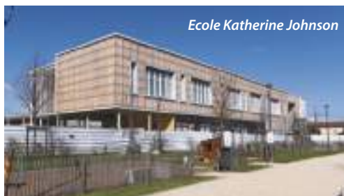
Ecole Katherine Johnson