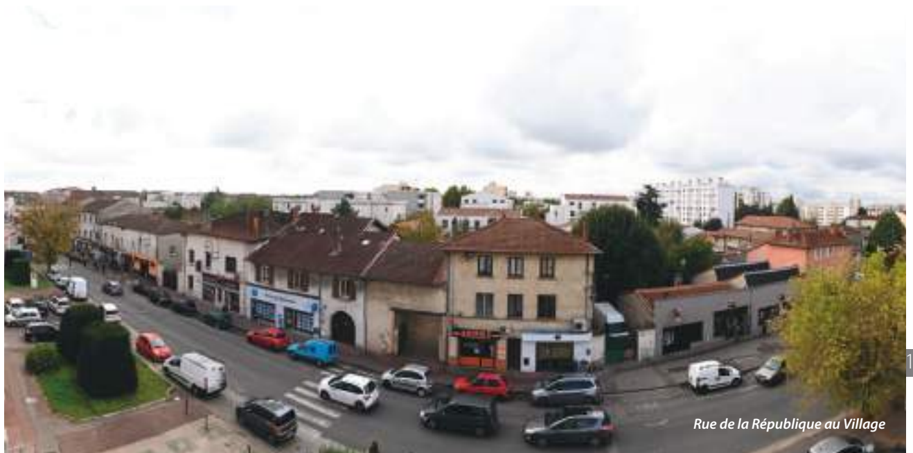
Rue de la République au Village