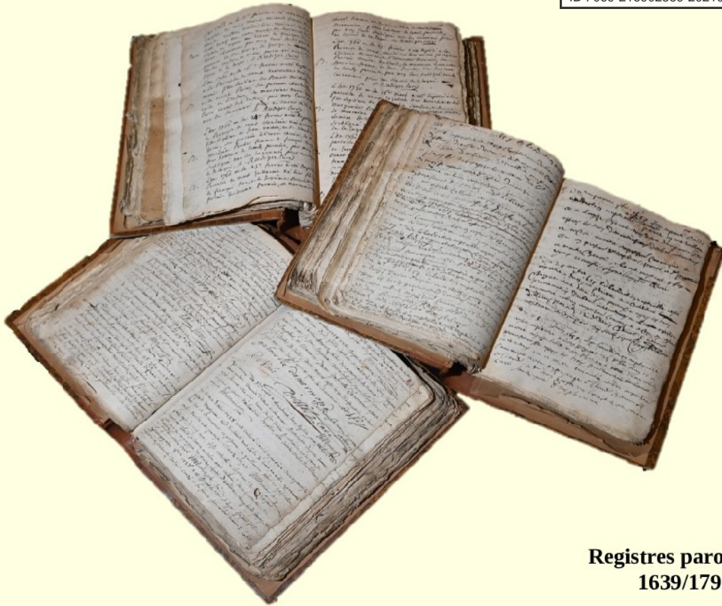
Registres paroissiaux 1639/1792