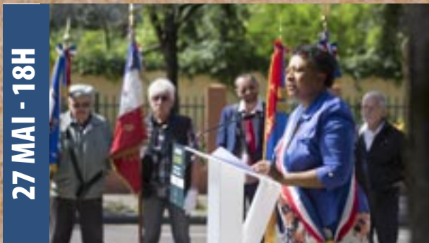
27 MAI - 18H

Où : au Monument aux Morts, place Gilbert-Dru.