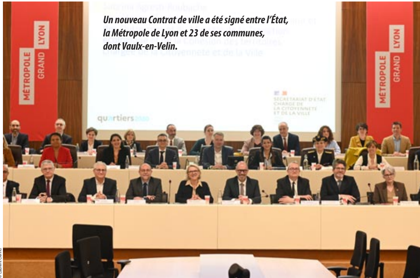
Un nouveau Contrat de ville a été signé entre l'État, la Métropole de Lyon et 23 de ses communes, dont Vaulx-en-Velin.

APRÈS plus d'un an de concertation avec les habitants et d'élaboration collective entre ses différents acteurs, le Contrat de ville métropolitain 2024-2030, baptisé "Engagements quartiers 2030", a été signé, vendredi 12 avril, à l'Hôtel de la Métropole de Lyon. Il s'agit du document-cadre qui définit les grandes orientations de la Politique de la Ville pour les six années à venir. Sont concernés les 43 Quartiers prioritaires de la Politique de la Ville (QPV) définis par l'État dans 17 communes de la Métropole. Mais aussi, et c'est une nouveauté, 28 Quartiers populaires métropolitains (QPM) dans 15 communes, reconnus par la Métropole comme étant dans "une situation fragile, sans atteindre toutefois les difficultés des QPV". Pour ap-