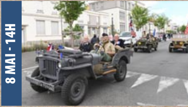
8 MAI - 14H

Où : au Monument des Droits de l'Homme, place de la Nation.