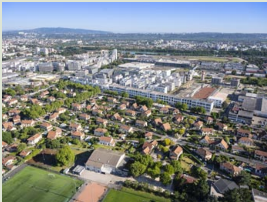
© Thierry Fournier - Métropole de Lyon