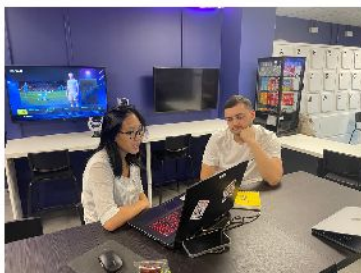
Le NECC est soutenu par Sogelink.

Le National E-sport Club and Community est fier d'avoir lancé son programme autour de l'insertion professionnelle en utilisant la passion des jeunes autour des jeux vidéo et de la transformer en compétences valorisables dans un CV. Depuis le lancement du projet, nous avons accompagné individuellement plus