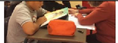
Le Valdocco est soutenu par Rainbow Partners

ID : 069-216902569-20240711-V_DEL_240711_26-DE