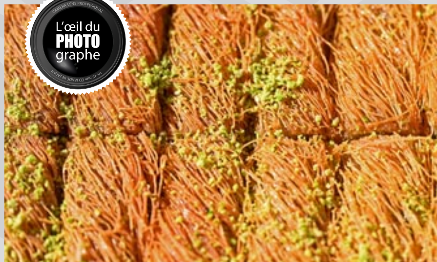
Pâtisserie orientale vue sur le marché du Ramadan, avenue Maurice-Thorez.