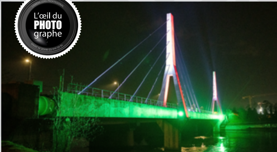
Illumination du Pont de la Sucrerie, en vigueur depuis lundi 8 décembre